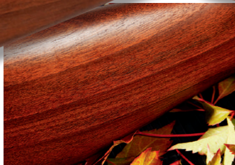
As madeiras são de nogueira europeia, contam com um bonito veio e acabamento a óleo.

A patilha de segurança, localizada no delgado da coronha, tem o funcionamento habitual neste tipo de armas, não é automática, pelo que sempre que desejarmos “travar” a arma temos que ativá-la. Tem ainda a função de seletor de tiro, o que nos permite escolher qual dos canos queremos disparar primeiro. O gatilho único apresenta dimensões generosas, sendo