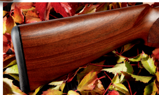
A coronha é baixa e curta, favorecendo o encare rápido e intuitivo.