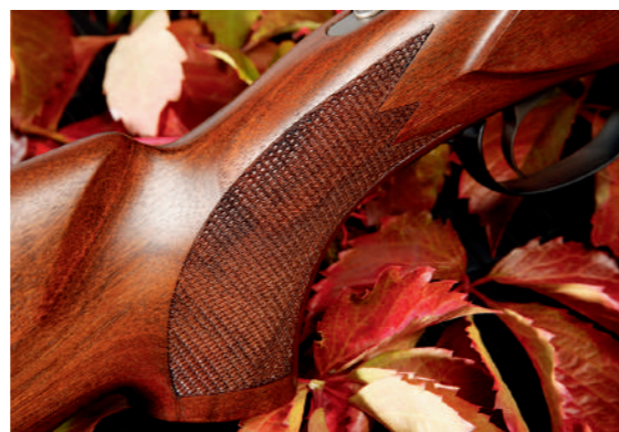
O punho de pistola é muito ergonómico, permitindo um bom acesso ao gatilho e conta com recartilhado efetuado a laser.