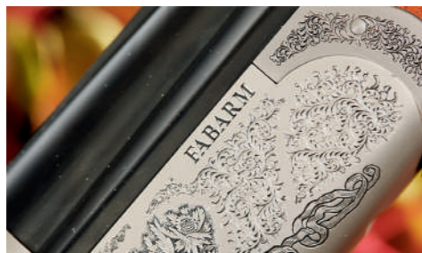
Na báscula encontramos bonitas gravuras de motivos florais muito bem executados.