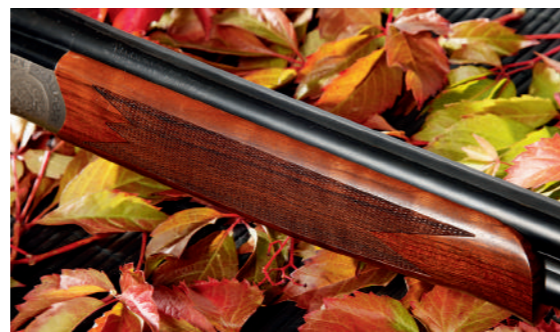
O fuste destaca-se por ser estreito e por uma linha que se enquadra na espingarda.