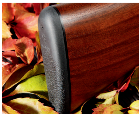
O calço tem quase um centímetro de espessura e é em borracha suave de cor negra.