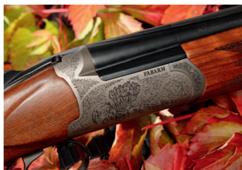
A báscula é muito ligeira, fabricada em liga de alumínio (Ergal 55), leve e resistente.