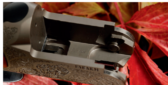
Detalhe do interior da báscula, onde se vê a platina que trava o bloco dos canos.