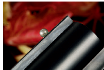
Na boca de fogo encontramos um pequeno ponto de mira que cumpre a sua função.