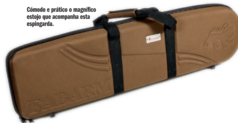
Cómodo e prático o magnífico estojo que acompanha esta espingarda.

possível regular a sua posição longitudinal.