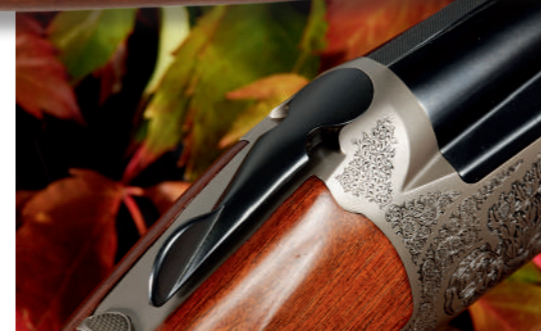
A alavanca de abrir é cómoda e ergonómica, manipulando-se sem esforço.