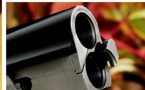
Esta espingarda conta com sistema de expulsores que se ativam com o disparo.