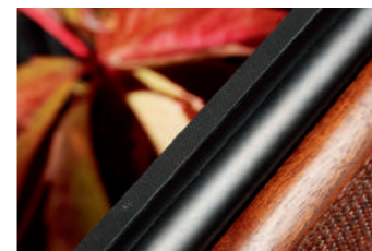
A fita ao longo de todo o comprimento dos canos, conta com 6 a 4 milímetros de largo.