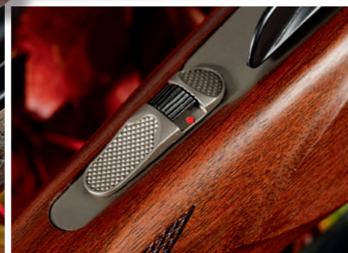
A patilha de segurança tem dupla função; trava a arma e funciona como seletor de tiro.