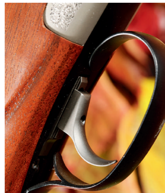
O gatilho pode ser regulado na sua posição longitudinal.