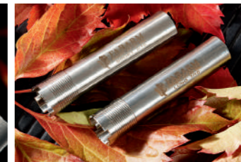
O fabricante fornece um kit completo de chokes internos.